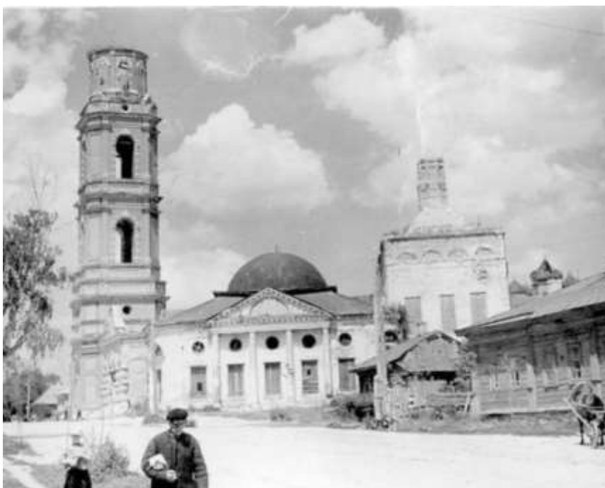
Георгиевский храм в советское время.